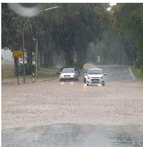
Stockum: Kreuzung Hörder Str. / Borgäcker bei Starkregen - Sinnbild für die Zukunft?

Oder wird sogar geplant, mit der Frackingmethode Gas zu fördern? Das zeitliche Zusammenfallen der Planung von Gewerbegebieten und der Beantragung von Probebohrungen scheint nicht ganz zufällig zu sein, wurde doch erst Mitte September die Stadt Witten von der Bezirksregierung aufgefordert, zu einem Aufsuchungsfeld Stellung zu nehmen. Die Rheinisch-Westfälische Technische Hochschule Aachen beantragte nämlich eine Verlängerung ihrer Erlaubnis zur Durchführung von Fracking-Probeförhungen.