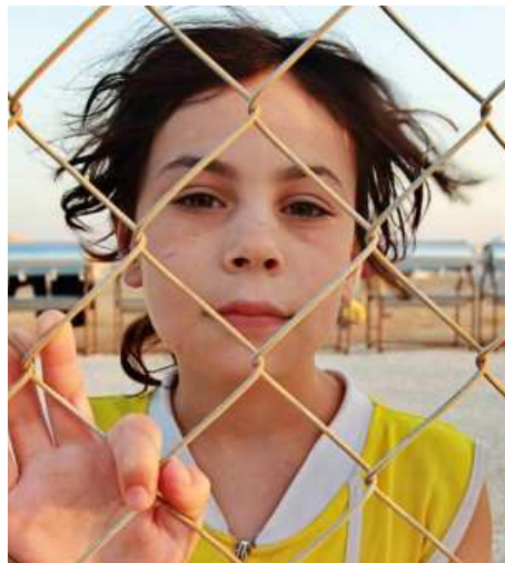
Menschen auf der Flucht brauchen Solidarität und Hilfe!

mende Abhängigkeit ausgenutzt wird, in dem aus Profitgier bewusst Umweltstandards verletzt werden oder durch Müllimporte wertvolles Land in Müllkippen verwandelt wird. Die ökonomische Abhängigkeit bei formaler Selbständigkeit nennt man auch Neokolonialismus .