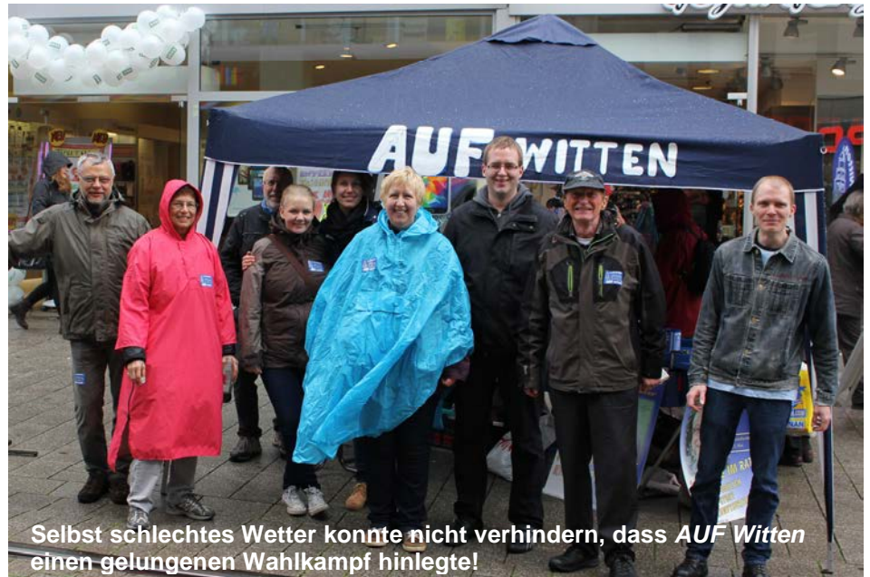
Selbst schlechtes Wetter konnte nicht verhindern, dass AUF Witten einen gelungenen Wahlkampf hinlegte!

Das garantiert, dass AUF Witten nicht zu einer korrupten Organisation verkommt. Dazu wird die Kasse regelmäßig revidiert. Der Kassierer legt hierzu ausführlich Rechenschaft ab.