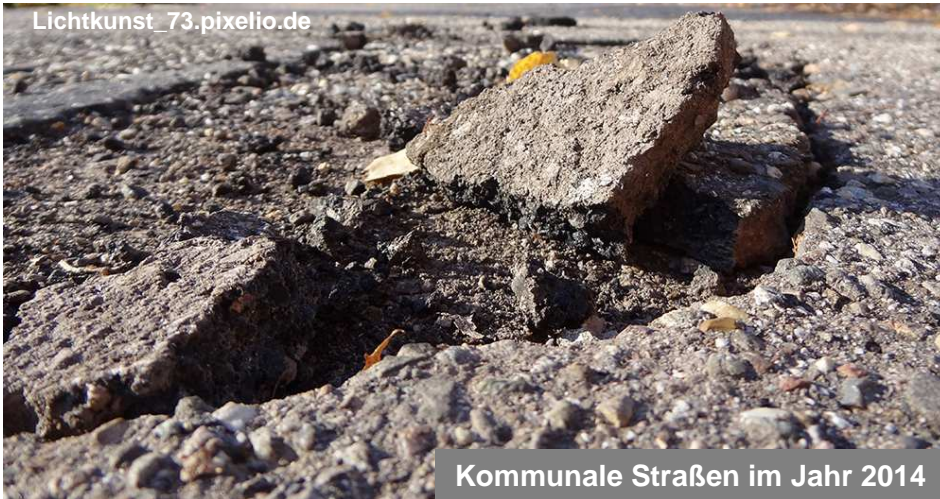
Kommunale Straßen im Jahr 2014

AUF Witten fordert seit zehn Jahren einen radikalen Schuldenschnitt, um aus diesem Wahnsinn herauszukommen: Sofortige Einstellung der Zinszahlungen an die Banken und ein neues Finanzierungssystem für die kommunale Daseinsvorsorge!