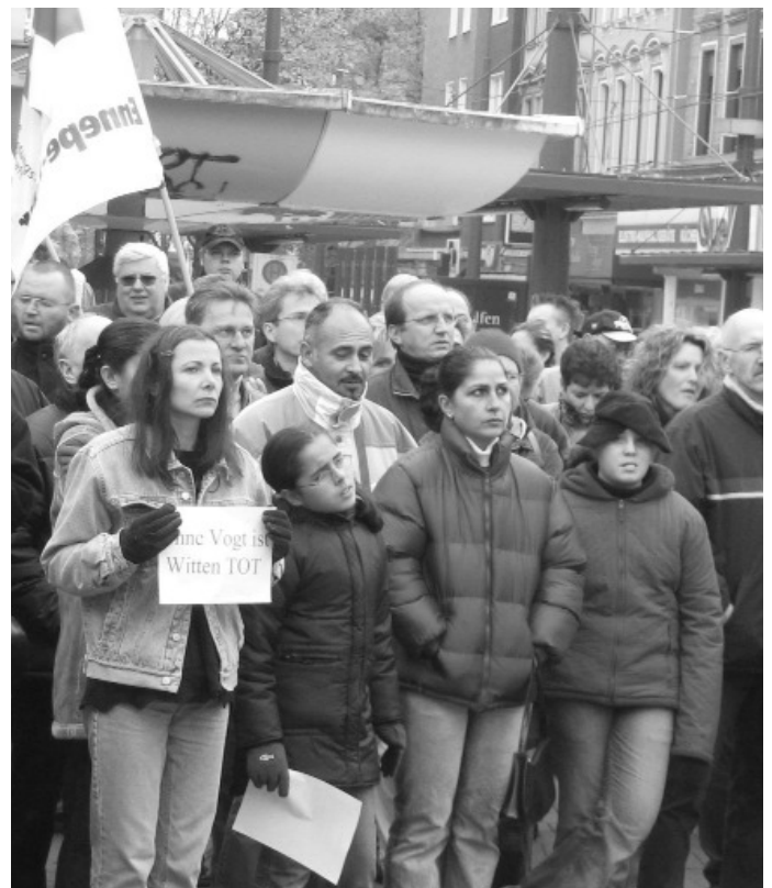
Beschäftigte von Vogt electronic demonstrieren im Oktober 2003 gegen die Entlassung von 395 Mitarbeitern

Dafür brauchen wir eine neue Politik im Stadtrat und frische, unverbrauchte Kräfte!