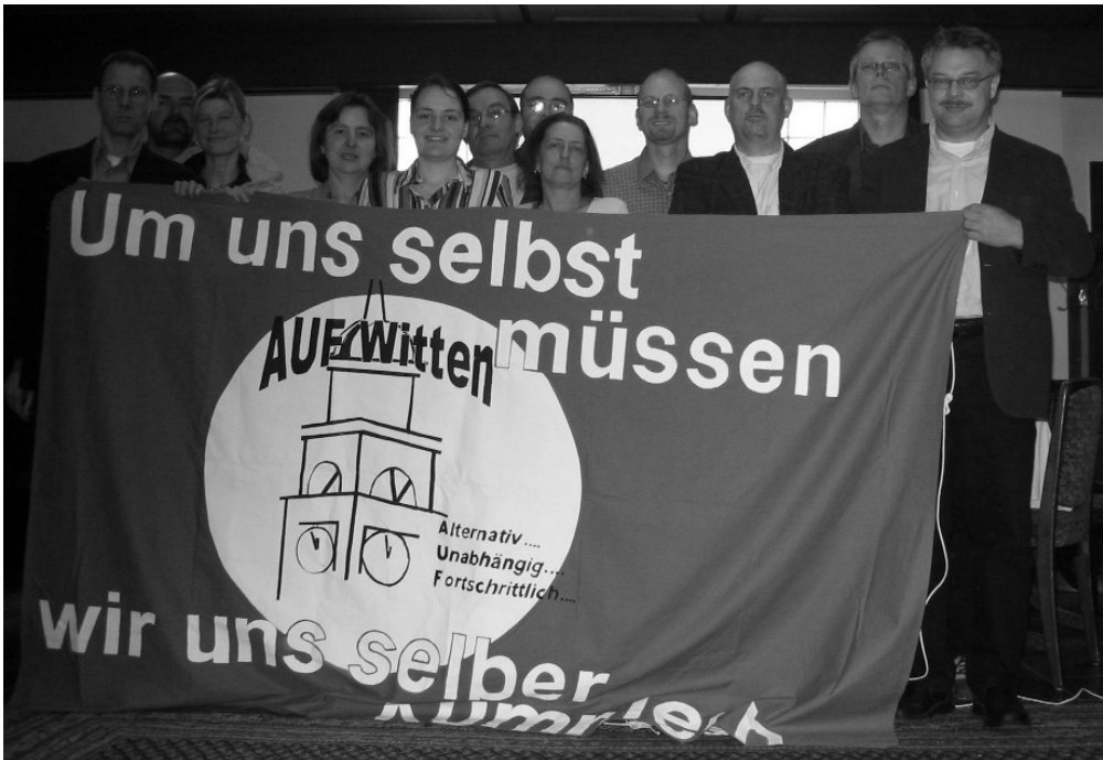
Die Kandidaten der Reserveliste mit dem Transparent, auf dem das Motto von AUF Witten zu sehen ist: Um uns selbst müssen wir uns selber kümmern