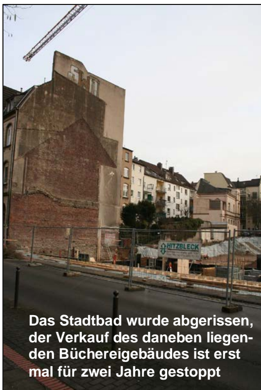
Das Stadtbad wurde abgerissen, der Verkauf des daneben liegenden Büchereigebäudes ist erst mal für zwei Jahre gestoppt

Der Vorstand von AUF Witten zum Erfolg der Bürgerinitiative „Rettet unsere Stadtbücherei“