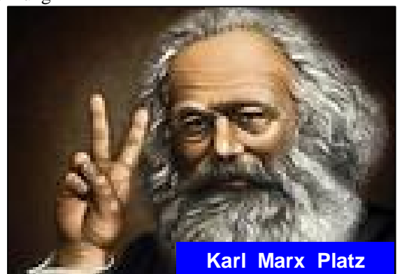
Karl Marx Platz

Angesichts dieses Horizonts ist der CDU-Antrag nicht nur eine Provinzposse, sondern ist, auch wenn er zurückgezogen wurde, als Provokation gegenüber allen, die fortschrittlichen und weltoffenen Geistes sind, zu werten.