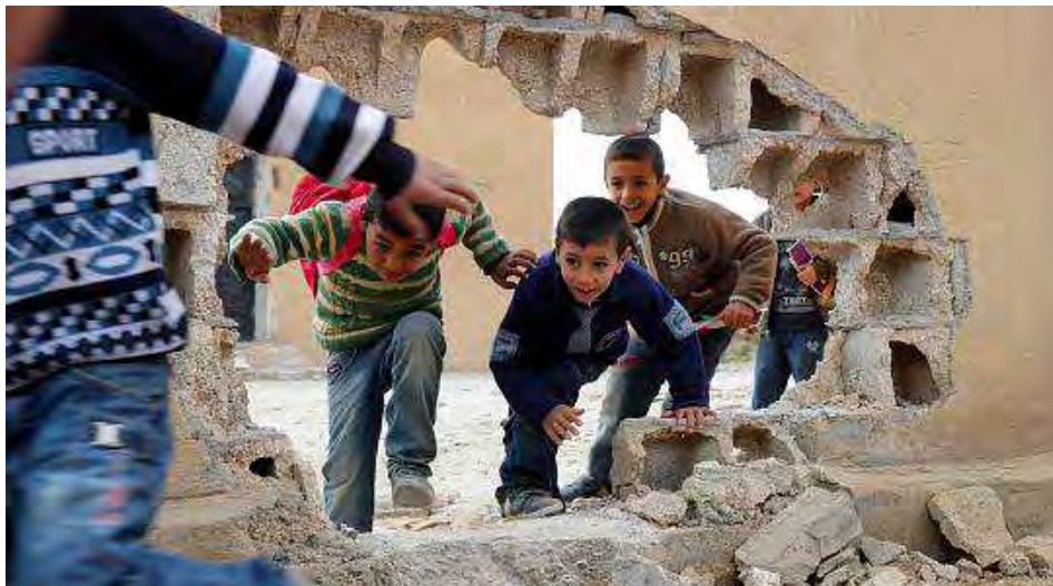
Das Leben kehrt zurück nach Kobanê

Das ist nicht nur eine Niederlage für den IS , sondern auch für alle fanatischen Nationalisten und Faschisten, auch hier in Deutschland.