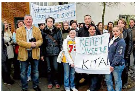
Das Internet ist voll von Protest gegen Kita Schließungen

dazu dienen soll, dass die Eltern die Kröte der Schließung der Kita hinnehmen sollen.