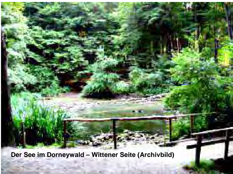
Der See im Dorneywald – Wittener Seite (Archivbild)