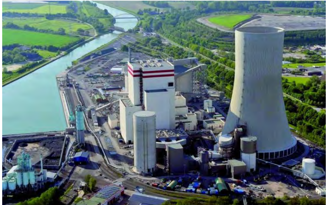
Steinkohlekraftwerk Lünen: ein anachronistisches Millionengrab

Der Giftmüll unter Tage muss auf Kosten der RAG beseitigt werden.