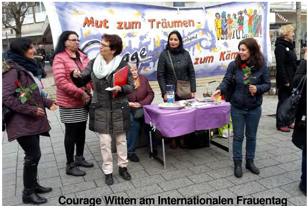
Courage Witten am Internationalen Frauentag

Die Corona Krise macht sichtbar, was schon lange bekannt ist : Katastrophale Schwächen im Bildungsbereich und Pflegenotstand in Krankenhäusern und Seniorenheimen.